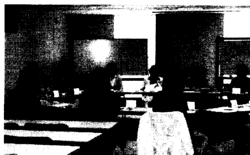
継続してつけるコツなどを交流しました

なお、交流会のご案内とともに皆さんにお伺いしたアンケートのまとめを次ページに紹介しています。