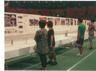
昨年の展示コーナーの様子