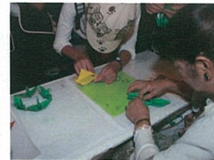
折り紙で作る「なかよしづる」にチャレンジ