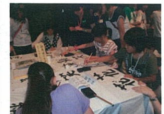
書道でピースメッセージコーナーは平和を一字で表現